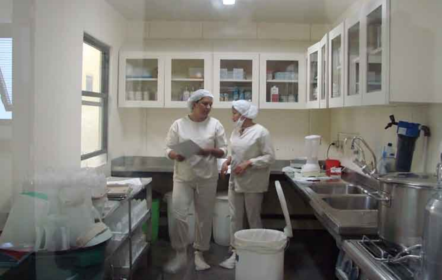
Setor de terapia nutricional

paro da NE, artesanal ou industrializada; qualificar fornecedores e assegurar que a entrega dos insumos e NE industrializada seja acompanhada do certificado de análise emitido pelo fabricante.