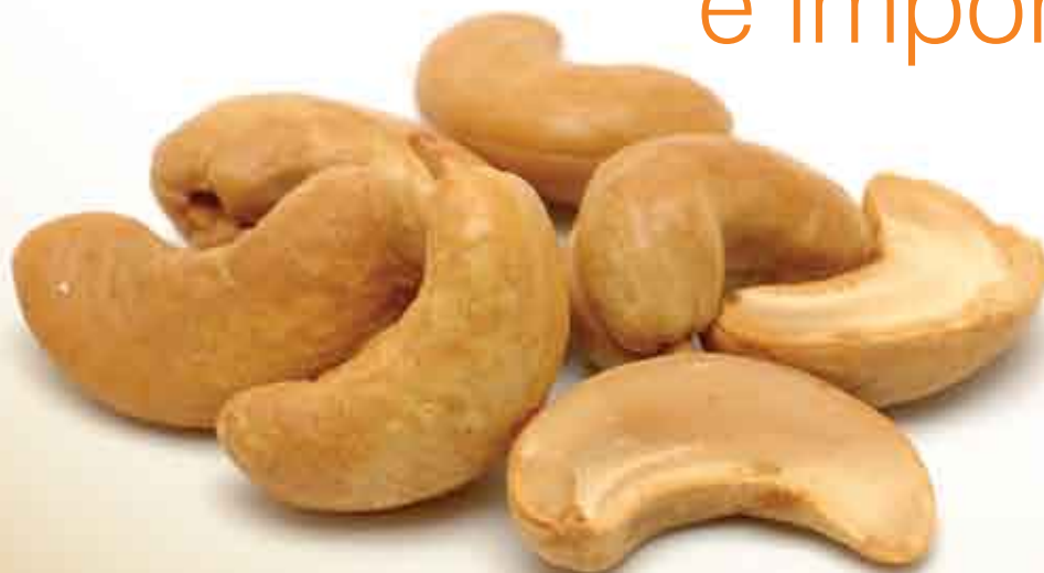
Castanha de caju, fonte de energia

Na linguagem da nutrição, energia se traduz em caloria.