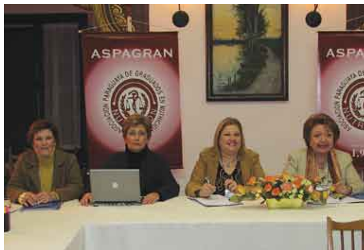
CFN apresentou dados sobre a profissão em encontro do Conumer em junho

tem as atribuições do nutricionista bem definidas em leis, diretrizes e resoluções do CFN, estes instrumentos estão sendo analisados pelos países-membros para a comparação das atividades privadas dos nutricionistas. O resultado desse trabalho deverá ser apreciado pelo Conumer e seguirá ao Subgrupo de Trabalho nº 11 do Mercosul.