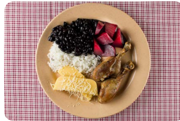
Arroz, feijão, coxa de frango assada, beterraba e polenta com queijo