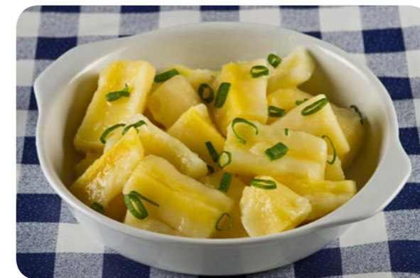
Mandioca cozida com cebolinha e/ou salsinha

Raízes e tubérculos são importantes fontes de carboidratos e fibras. A batata inglesa e a batata-doce fornecem vitamina C e a batata-doce é rica em precursores da vitamina A.