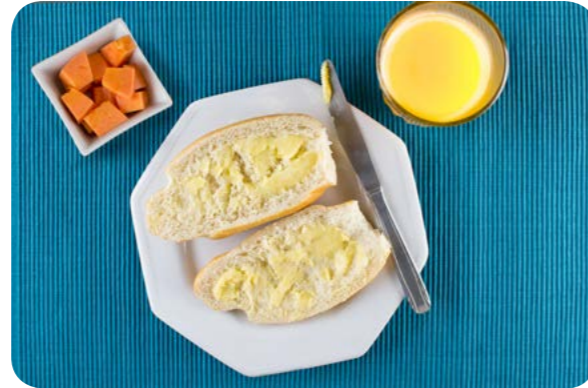
Suco de laranja natural, pão francês com manteiga e mamão