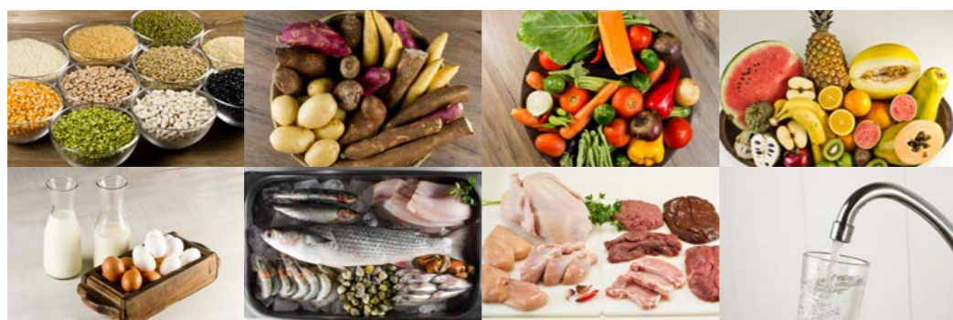
Alimentos incluem muitas variedades de grãos, tubérculos, legumes e verduras, frutas, leite, ovos, peixes, carnes e, também, a água.

Alimentos em grande variedade e predominantemente de origem vegetal formam uma base excelente para uma alimentação nutricionalmente equilibrada e saborosa. Variedade significa alimentos de todos os tipos, incluindo grãos, verduras, legumes, tubérculos, frutas, castanhas e nozes, cogumelos, água, leite e ovos, carnes e peixes, e variedade dentro de cada tipo (diferentes grãos, diferentes verduras ...)