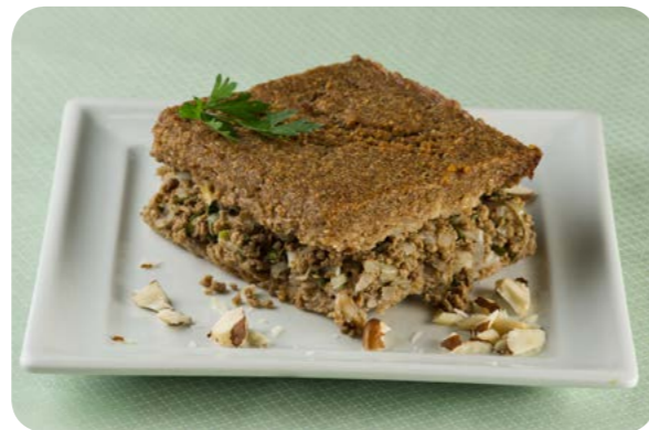
Quibe de carne assado com nozes