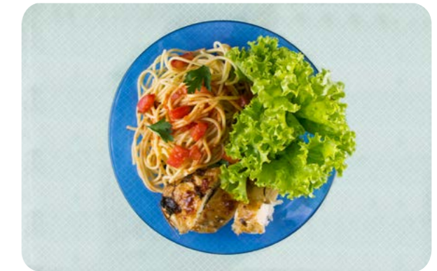
Salada de folhas, macarrão e galeto

Carnes de boi ou de porco novamente estão restritas a um terço das refeições. Nas demais refeições, frango, peixe, ovos e vários tipos de preparações de legumes e verduras 'substituem' as carnes vermelhas.