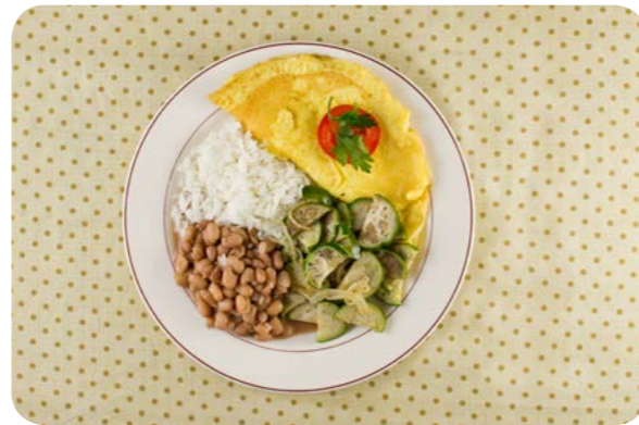
Arroz, feijão, omelete e jiló refogado

Aqui apresentamos a composição do almoço de oito brasileiros selecionados dentre aqueles que baseiam sua alimentação em alimentos e preparações culinárias.