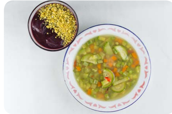
Sopa de legumes, farinha de macaxeira e açaí