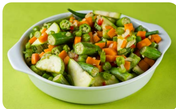
Mix de legumes refogados

Legumes em conserva como cenouras, pepinos, cebolas (assim como ervilhas, batata e outros alimentos em conserva) preservam grande parte dos nutrientes do alimento fresco, porém por seu conteúdo elevado de sal (sódio) devem ser consumidos apenas ocasionalmente.