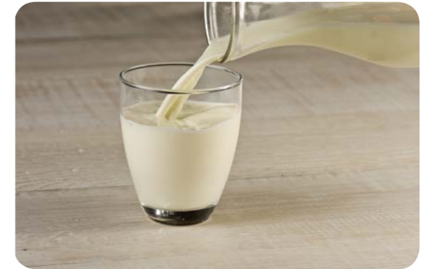
Copo de leite de vaca

Bebidas lácteas adoçadas e adicionadas de corantes e saborizantes, incluindo iogurtes, são produtos ultraprocessados e, como tal, devem ser evitados.