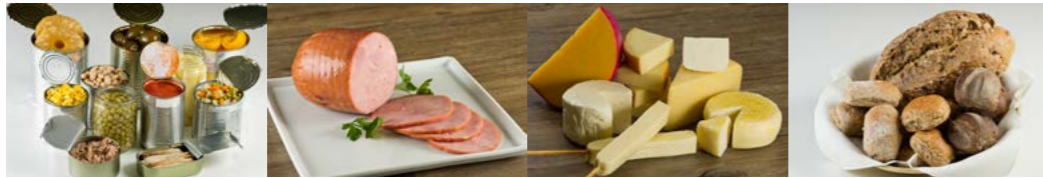
Produtos prontos para consumo processados incluem alimentos em conserva, compotas de frutas e frutas cristalizadas, carnes adicionadas de sal, queijos feitos de leite e sal e pães feitos de farinha de cereais, água e sal.

Produtos prontos para consumo processados são produtos relativamente simples e antigos feitos pela indústria essencialmente com a adição de sal ou açúcar (e por vezes vinagre ou óleo) a alimentos. As técnicas de processamento podem incluir cozimento, secagem, fermentação, acondicionamento dos alimentos em latas ou vidros e o uso de métodos de preservação como salga, salmoura, cura e defumação. Produtos processados em geral são facilmente reconhecidos como versões modificadas do alimento original.