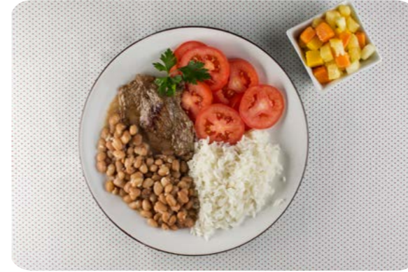
Salada de tomate, arroz, feijão, bife grelhado e salada de frutas