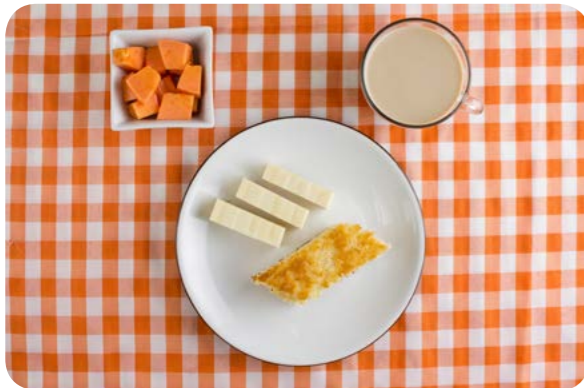
Café com leite, bolo de mandioca, queijo e mamão