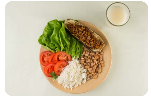
Alface e tomate, arroz, feijão, berinjela recheada e suco natural de cupuaçu

Para ilustrar as possibilidades de aumentar e diversificar o consumo desses alimentos, procuramos refeições onde diferentes tipos de verduras e legumes (alface, tomate, acelga, couve, repolho, abóbora, beterraba, quiabo, berinjela, jiló) aparecem preparados de diferentes formas, crus em saladas ou em preparações cozidas ou refogadas.