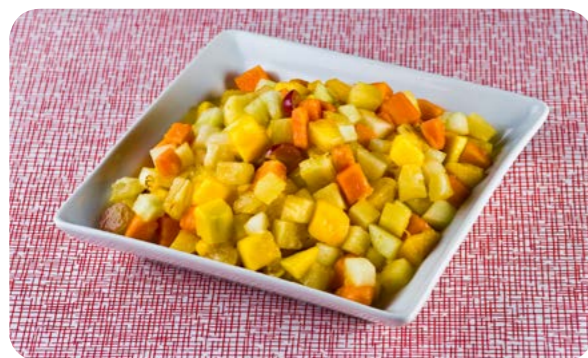
Salada de frutas

Crianças e adolescentes, em face das necessidades nutricionais relacionadas ao crescimento, usualmente precisam fazer uma ou mais refeições, além do café da manhã, almoço e jantar. O mesmo pode ocorrer em outras fases do curso da vida.