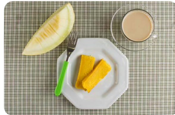
Café com leite, bolo de milho e melão

Aqui apresentamos a composição do café da manhã de oito brasileiros selecionados dentre aqueles que baseiam sua alimentação em alimentos e preparações culinárias.