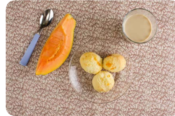
Café com leite, pão de queijo e mamão