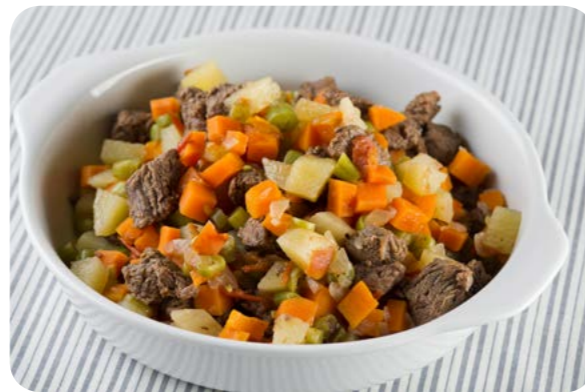
Cozido de carne vermelha com batata e legumes