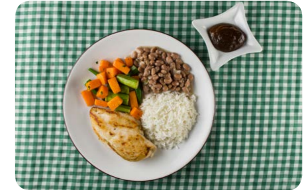
Arroz, feijão, peito de frango grelhado, abóbora com quiabo e compota de jenipapo