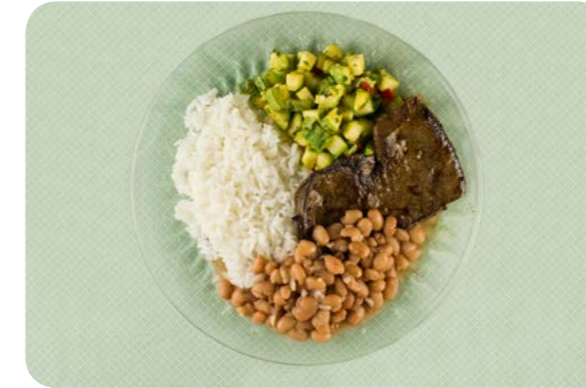
Arroz, feijão, fígado bovino e abobrinha refogada