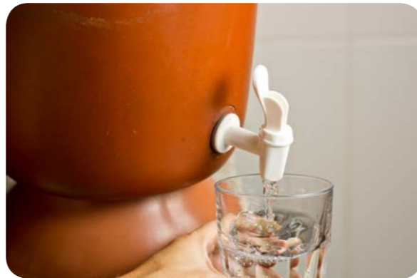
Filtro de barro