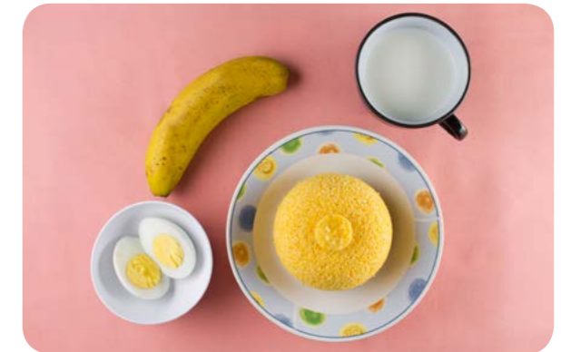
Leite, cuscut, ovo de galinha e banana

cias regionais exemplificadas com o consumo da tapioca no Norte, do cuscut no Nordeste e do bolo de milho no Centro-Oeste.