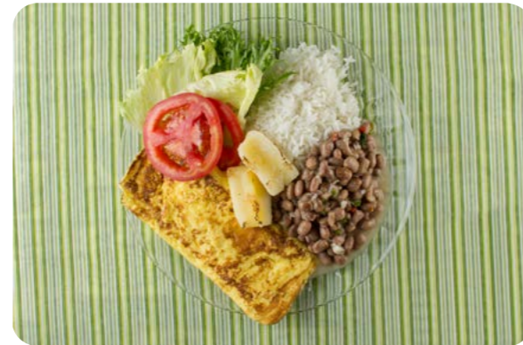
Alface e tomate, arroz, feijão, omelete e mandioca no forno.

Aqui apresentamos a composição do jantar de oito brasileiros selecionados dentre aqueles que baseiam sua alimentação em alimentos e preparações culinárias.