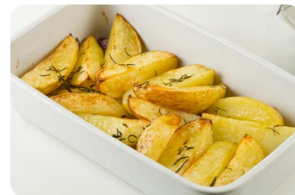
Batata inglesa ao forno com ervas