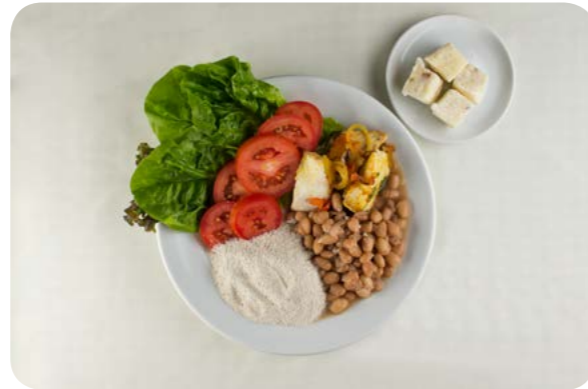
Alface, tomate, feijão, farinha de mandioca, peixe ensopado e cocada