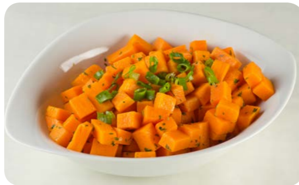
Abóbora refogada com cebola, cebolinha e/ou salsinha

Legumes e verduras são alimentos excepcionalmente saudáveis. São excelentes fontes de fibras, de vitaminas e minerais e de vários compostos bioativos que contribuem para a prevenção de várias doenças. São alimentos que possuem alta densidade de nutrientes e baixa concentração de calorias, características que os tornam ideais para a prevenção do consumo excessivo de energia e da obesidade e das doenças crônicas associadas a esta condição, como as doenças do coração e o diabetes.