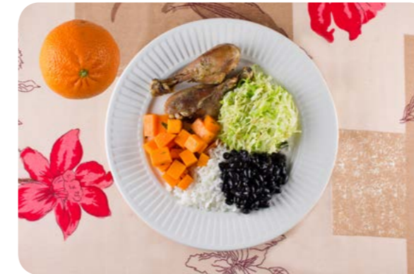
Arroz, feijão, coxa de frango assada, repolho refogado, moranga cozida e laranja