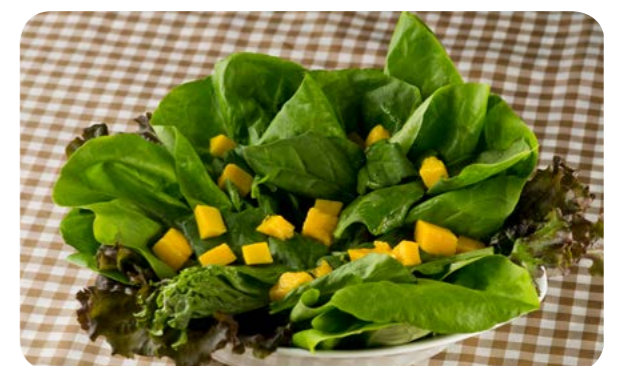
Salada de folhas com manga