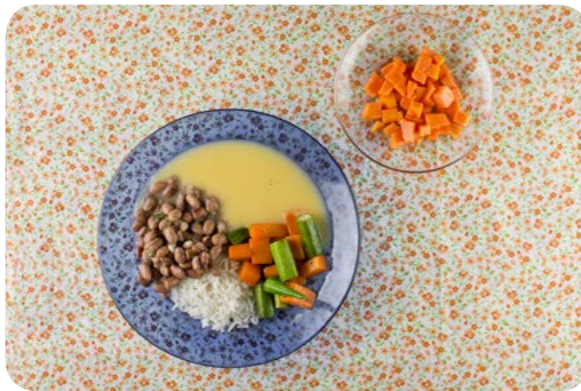
Arroz, feijão, angu de milho, abóbora com quiabo e mamão