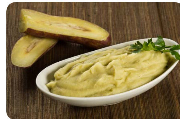
Purê de batata doce