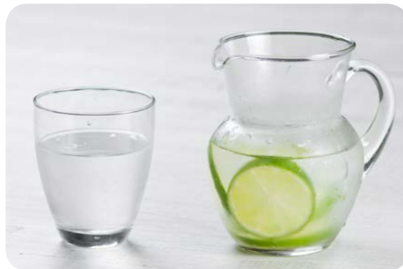
Água com limão

quando bebemos um copo de água. Ingerimos água quando consumimos alimentos e preparações culinárias ou mesmo quando consumimos produtos prontos para consumo.