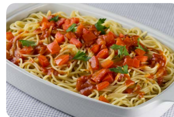
Macarrão com molho de tomate e ervas frescas