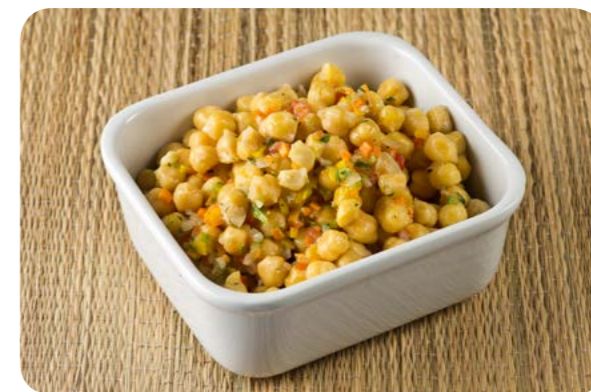
Grão-de-bico em salada