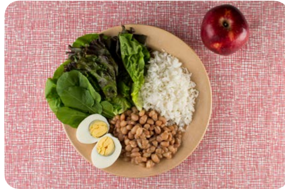
Salada de folhas, arroz, feijão, ovo de galinha cozido e maçã