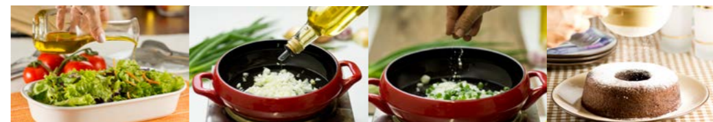
Óleos, gorduras, sal e açúcar são produtos alimentícios usados para temperar e cozinhar alimentos e para criar preparações culinárias.

Desde que utilizados com moderação em preparações culinárias com base em alimentos, óleos, gorduras, sal e açúcar contribuem para diversificar e tornar mais saborosa a alimentação sem comprometer o seu valor nutricional