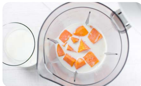
Leite batido com frutas

Nesses casos, frutas frescas ou secas, leite ou iogurte natural e castanhas ou nozes são excelentes alternativas na medida em que são alimentos com alto teor de nutrientes e com alto poder de saciedade, além de serem naturalmente ‘prontos para consumo’.