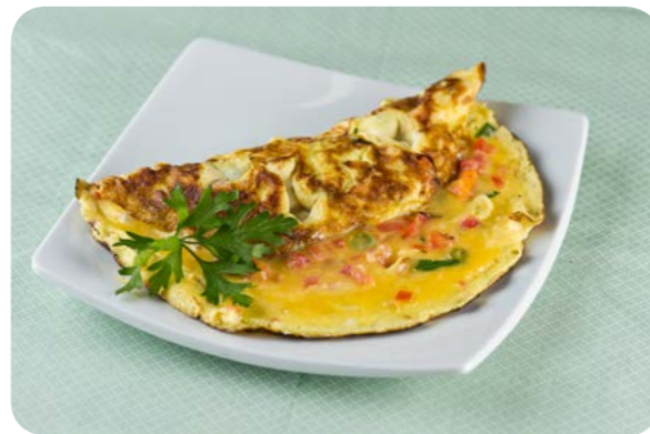
Omelete com legumes

saudáveis mostradas neste capítulo, priorizando sempre cortes mais magros de carne. Além disso, no caso das carnes vermelhas e, também, no caso das demais carnes, procuramos selecionar preparações grelhadas, assadas ou ensopadas, que utilizam menos óleo.