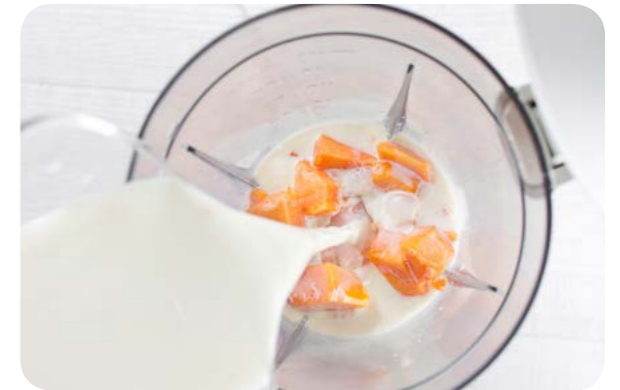
Vitamina de mamão com leite de vaca