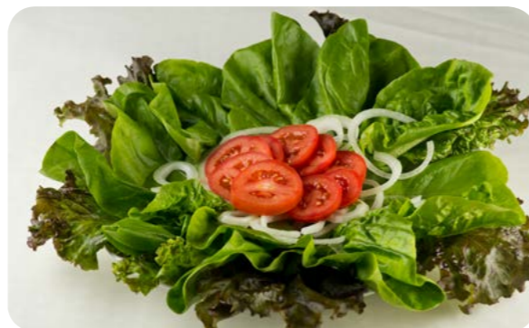
Salada crua de alface, tomate e cebola