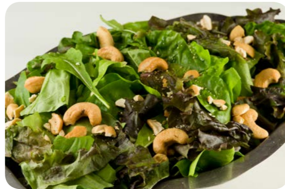
Salada de folhas com castanhas de caju

Todas as sementes oleaginosas são alimentos ricos em minerais, vitaminas, fibras e gorduras saudáveis e, como legumes, verduras e frutas, contêm compostos bioativos que promovem a saúde e previnem doenças. Como no caso dos demais alimentos, deve-se evitar o consumo de castanhas, nozes, amêndoas e amendoim adicionados de sal ou açúcar.