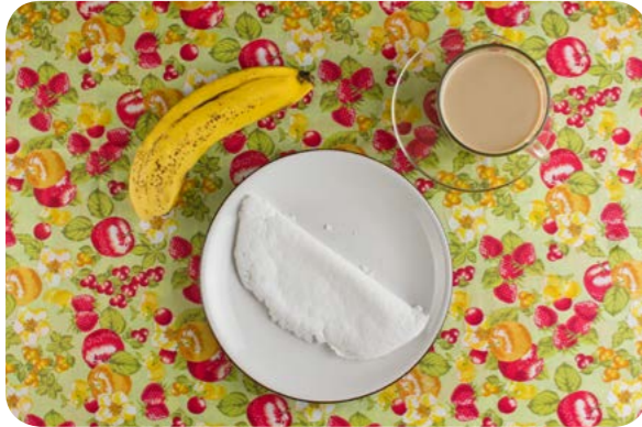
Café com leite, tapioca e banana