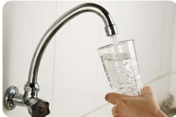
Água da torneira

A recomendação deste Guia com relação à quantidade de água que devemos ingerir é extremamente simples: a quantidade que nosso organismo (ou nossa sede) pedir. Mas, é preciso lembrar que ingerimos água não apenas