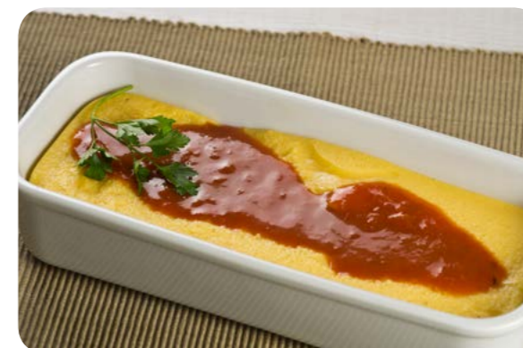
Polenta de milho com molho de tomate