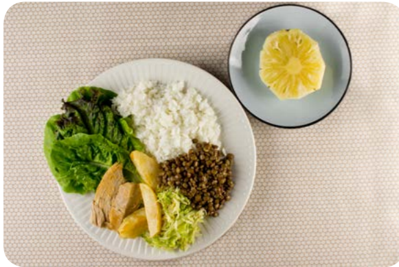
Alface, arroz, lentilha, pernil suíno assado com batata, repolho refogado e abacaxi