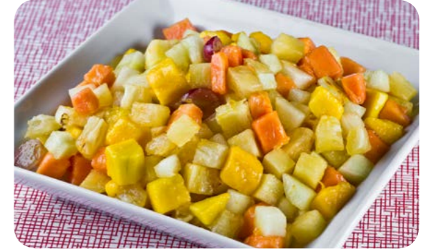
Salada de frutas

Frutas processadas com a adição de açúcar, como frutas cristalizadas e frutas em calda, preservam grande parte dos nutrientes das frutas frescas, mas, por conta do seu elevado teor de açúcar devem ser consumidas sempre em pequenas quantidades, complementando refeições baseadas em alimentos. Sucos de fruta industrializados e adicionados de açúcar de mesa, de concentrados de uva ou maçã ou de adoçantes, são produtos ultraprocessados e, como tal, devem ser evitados.