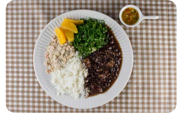
Feijoada, arroz, vinagrete de cebola e tomate, farofa, couve refogada e laranja