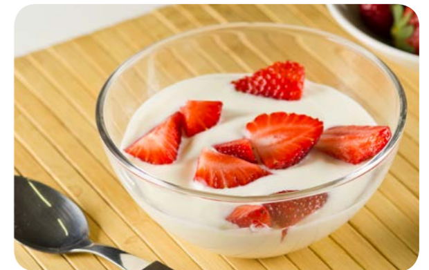
Iogurte natural com fruta