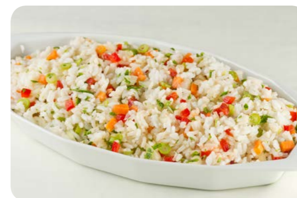
Arroz com legumes

Embora menos consumido do que o arroz, o milho também é bastante versátil, sendo um item importante da alimentação brasileira. Seu consumo é frequente na forma do próprio grão - na espiga cozida, por exemplo - ou em preparações culinárias de cremes e sopas. O milho integra ainda receitas de vários quitutes e doces brasileiros, como canjica de milho, mungunzá, mingaus, pamonha e curau. A farinha de milho é muito usada para fazer cuscuz, angu, farofa, bolo de milho, polenta, pirão e xerém, preparações consumidas no almoço e no jantar e, em algumas regiões do país, também no café da manhã.