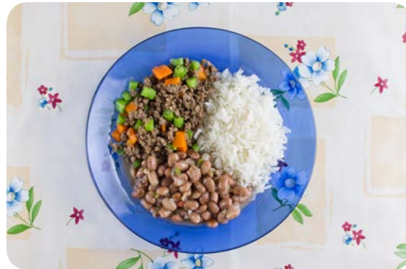
Arroz, feijão, carne moída com legumes