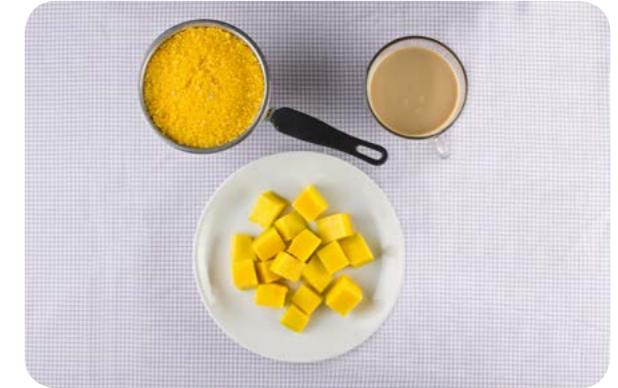
Café com leite, cuscut e manga