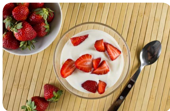
Iogurte com frutas