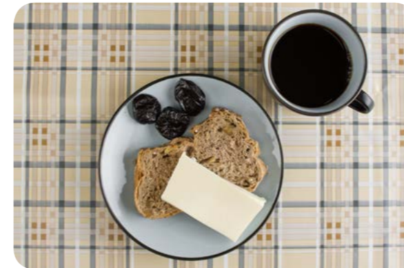
Café, pão integral com queijo e ameixa