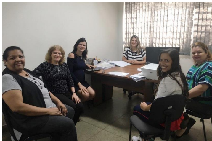
Secretaria de Educação