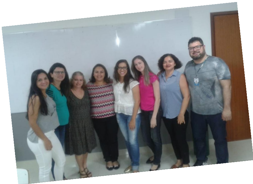
Nutricionistas de Itaperuna