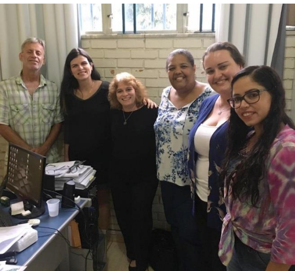
Secretaria de Assistência Social