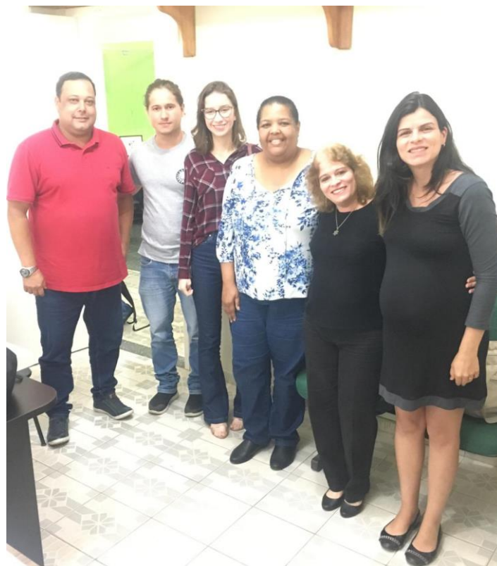
Secretaria de Saúde