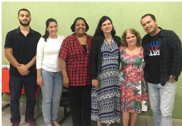
Secretaria de Educação