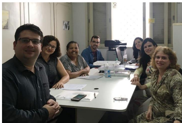
Secretaria de Saúde