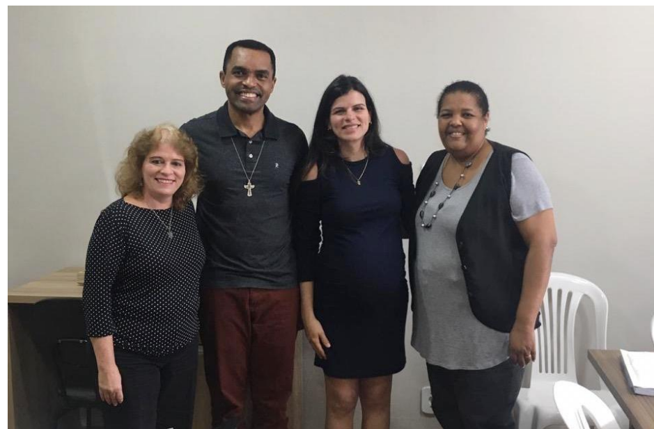
Secretaria de Assistência Social