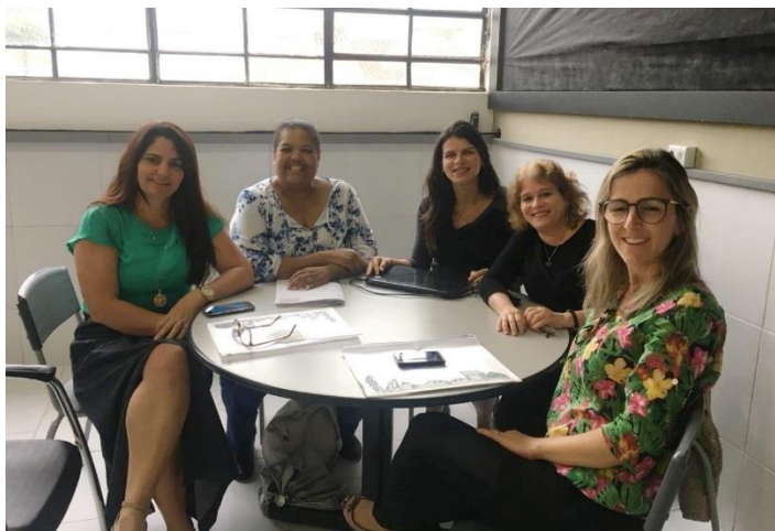
Secretaria de Educação