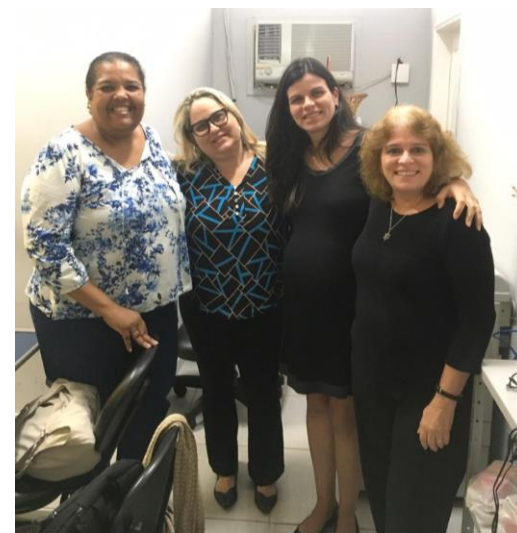
Secretaria de Saúde