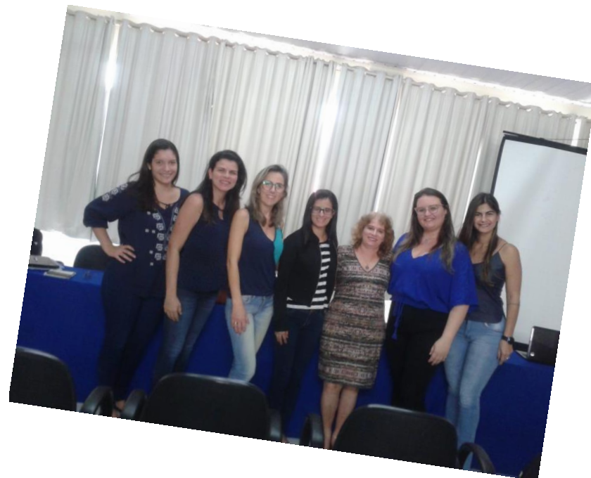
Nutricionistas de Santo Antônio de Pádua e Miracema