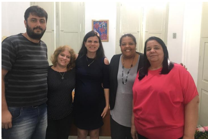
Secretaria de Assistência Social