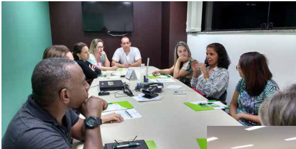
Os CRN da 8ª e 9ª regiões, a exemplo dos demais, promoveram discussões sobre o novo Código