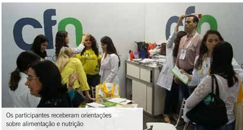
Os participantes receberam orientações sobre alimentação e nutrição