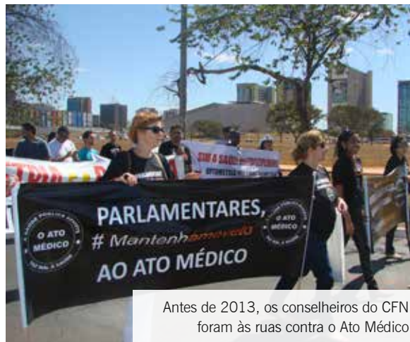
Antes de 2013, os conselheiros do CFN foram às ruas contra o Ato Médico

foram publicados os passos de como votar na consulta pública. A mobilização de profissionais, conselhos e organizações da Saúde levou à retirada da pauta do PLS 350/2014. Na consulta pública, 114.706 pessoas se ma-