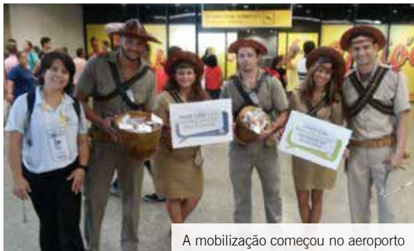
A mobilização começou no aeroporto