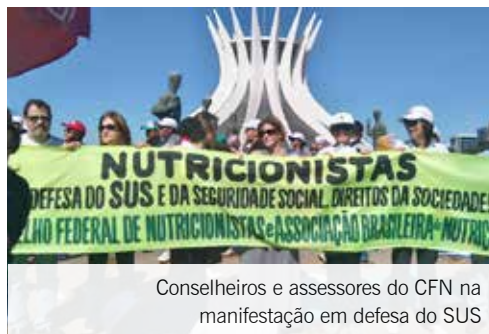
Conselheiros e assessores do CFN na manifestação em defesa do SUS

No último dia 9 de agosto, o parecer sobre a PEC 241 foi aprovado pela Comissão de Constituição e Justiça da Câmara dos Deputados. Como se não bastassem os cortes na saúde realizados em 2015 e neste ano, a medida prevê mais cortes para os próximos anos e é um atentado contra o SUS. Para que essa PEC não seja con-