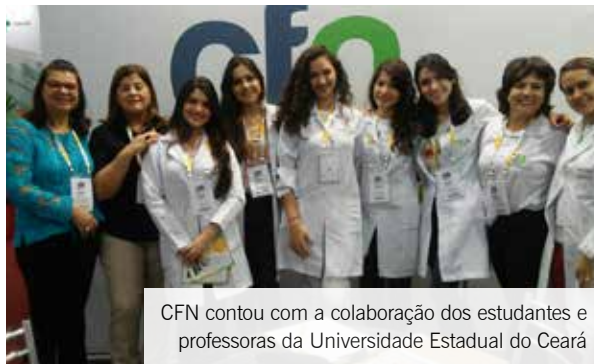
CFN contou com a colaboração dos estudantes e professoras da Universidade Estadual do Ceará

A inserção do nutricionista em políticas públicas contou com mais um reforço do CFN. Durante a realização do 32º Congresso do Conselho Nacional de Secretários Municipais de Saúde (Conasems), de 1º a 4 de junho, em Fortaleza/CE, o Conselho promoveu várias ações para mostrar o importante papel dos nutricionistas nas políticas públicas de alimentação e nutrição desenvolvidas nos municípios.