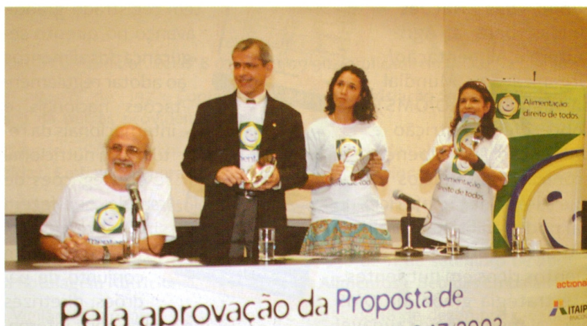
Manifestação pela aprovação da PEC 047