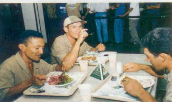
Trabalhadores durante almoço em restaurante de uma empresa, em Brasília.

seus clientes, inevitavelmente estará agregando o PAT. Tem ocorrido uma grande renovação do mercado de trabalho, que está sendo incrementado com novas teorias, técnicas e legislações (qualidade total, ISO 9000, Código de Defesa do Consumidor), obrigando os nutricionistas a se reciclarem e a terem uma visão menos tecnicista e mais holística, voltada para a satisfação de seu cliente.